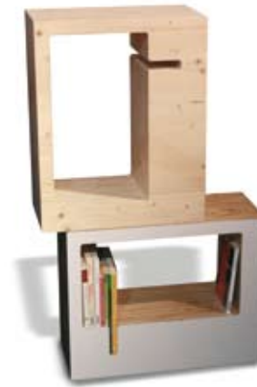
BIBLI-BULLES Modules bibliothèques à em- piler, les bibli-bulles ont un ca- ractère évolutif. L'achat de dif- férents modules accompagnent celui de livres à travers le temps et la vie d'un individu. Le décroché intérieur de cha- que élément permet d'utiliser le livre lui-même comme serre livre.

panneaux de latté plaqués noyer US et laque blanche satinée