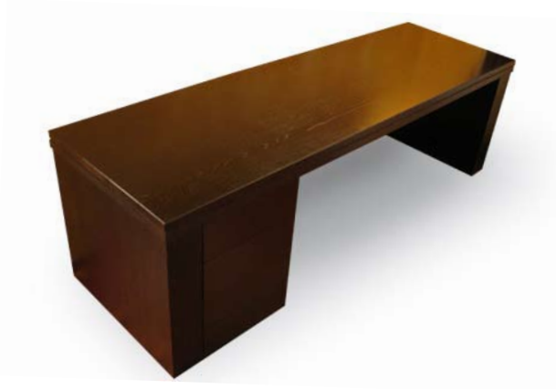
BUREAU DE « MINISTRE » Bureau sur mesure, longueur : 2m50

chêne massif et panneaux pla- qués chêne, teintés wengé