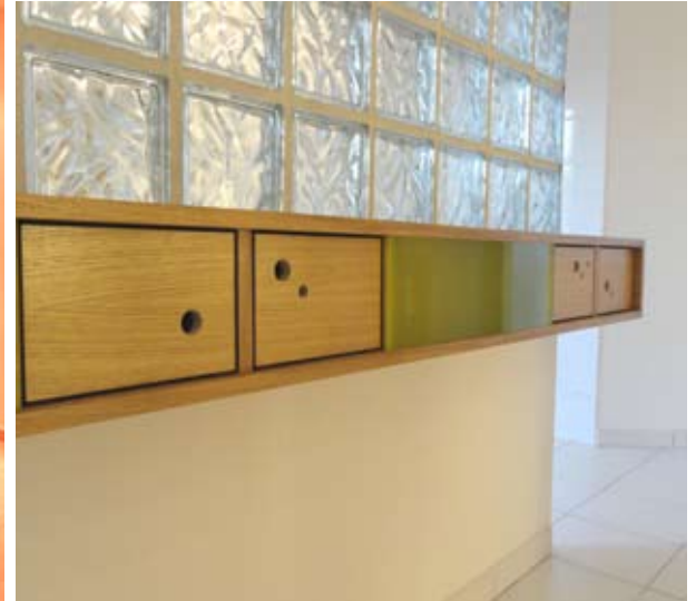
AGENCEMENTS INTERIEURS SUR MESURE Meuble et composition TV, caisson de rangement