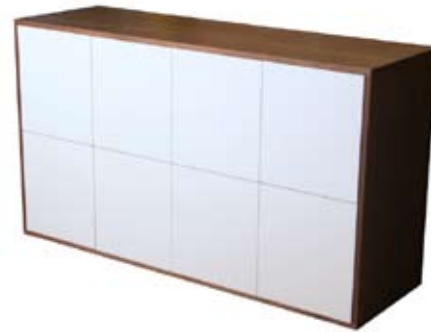
MEUBLE DE RANGEMENT Epuré et fonctionnel, ce meuble aux multiples portes, associe la noblesse du placage de noyer à la pureté de la laque blanche satinée.

chêne massif et panneaux pla- qués chêne, teintés wengé