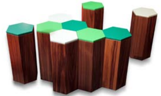
HEXAGONES Les hexagones sont des petits volumes à éclater dans une pièce, en guéridons ou bouts de canapé et à rassembler en table basse ou assises d'appoint. Outre leur multifonctionnalité, ils assument un aspect sculptu- ral et décoratif indéniable.

panneaux de latté plaqués noyer et laque satinée