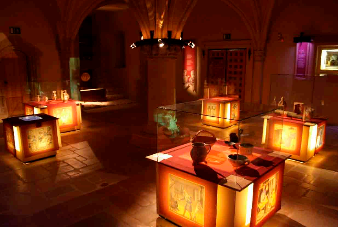
PARCOURS PERMANENT DU CHATEAU DE MALBROUCK I MANDEREN CONCEPTION & MAITRISE D'ŒUVRE