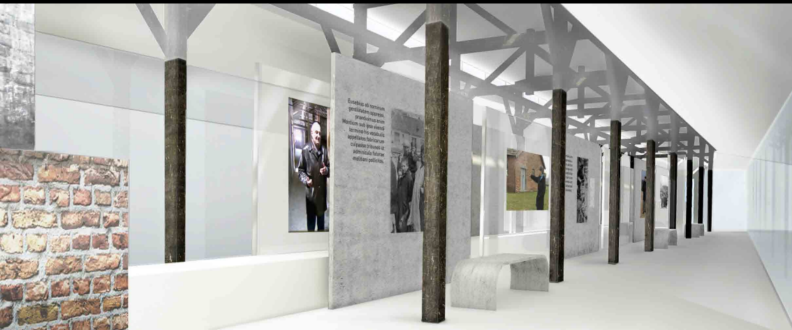
CAMP D'AUSCHWITZ-BIRKENAU, DISPOSITIF DE MEMOIRE | POLOGNE PROGRAMMATION