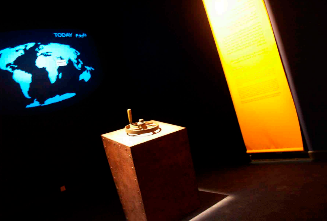
CENTRE D'INTERPRETATION BAIT AL BARANDA I MASCATE, SULTANAT D'OMAN PROGRAMMATION, CONCEPTION & MAITRISE D'ŒUVRE