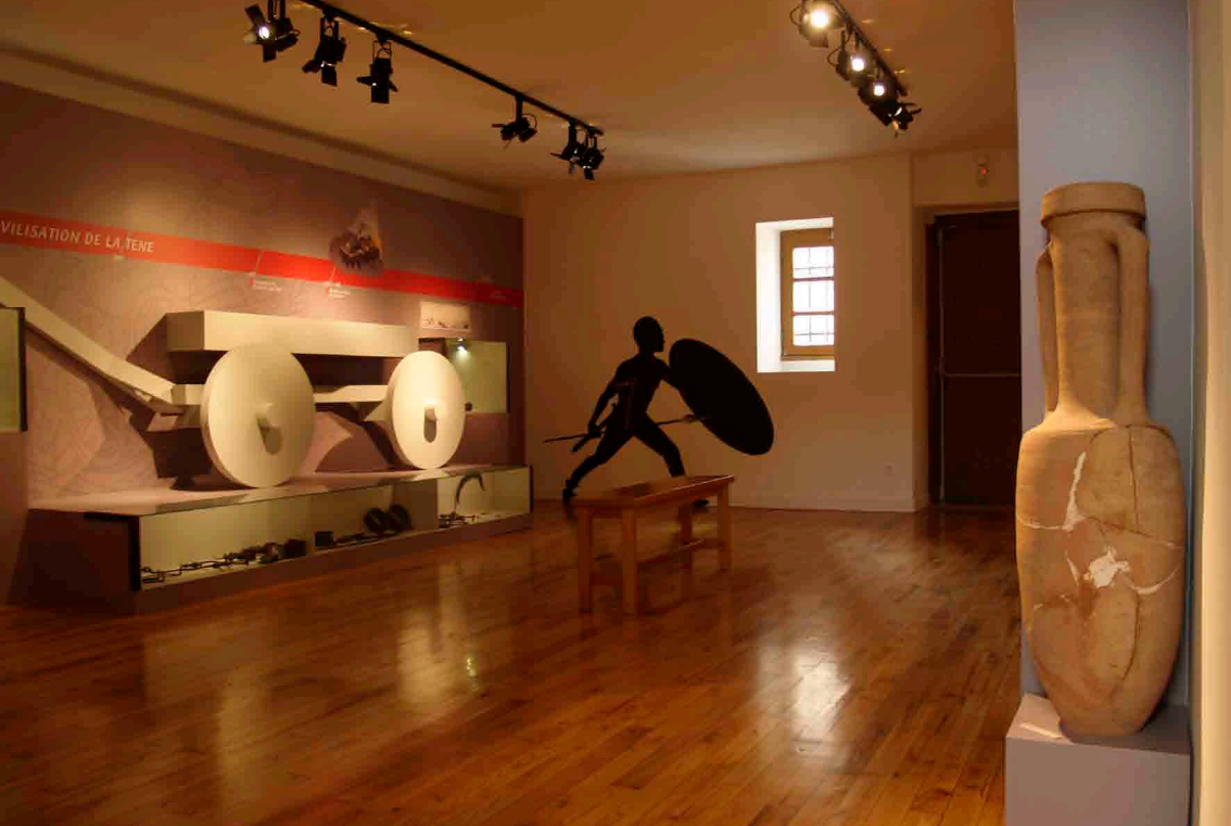
MUSEE DU PATRIMOINE ARCHEOLOGIQUE, SITE DE LARINA | HIERES-SUR-AMBY CONCEPTION & MAITRISE D'ŒUVRE