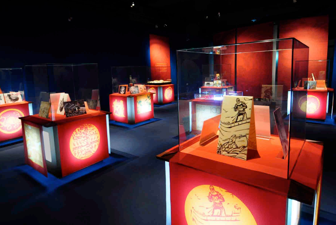
CENTRE D'INTERPRETATION DES TORTUES MARINES | RAS AL JINZ, SULTANAT D'OMAN CONCEPTION & MAITRISE D'ŒUVRE