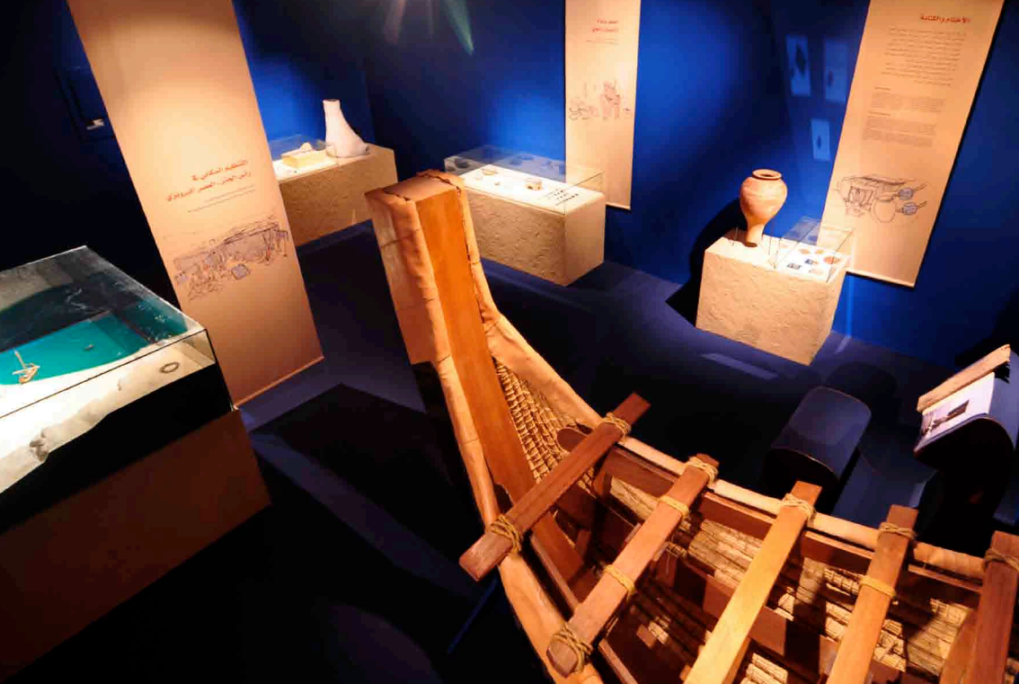
CENTRE D'INTERPRETATION DES TORTUES MARINES | RAS AL JINZ, SULTANAT D'OMAN CONCEPTION & MAITRISE D'ŒUVRE