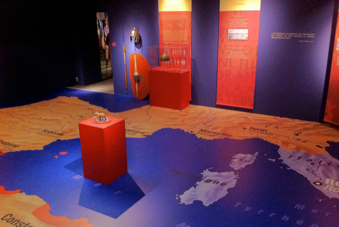
MUSEE DAUPHINOIS, EXPOSITION «HANNIBAL ET LES ALPES» | GRENOBLE GRAPHISME, CONCEPTION & MAITRISE D'ŒUVRE