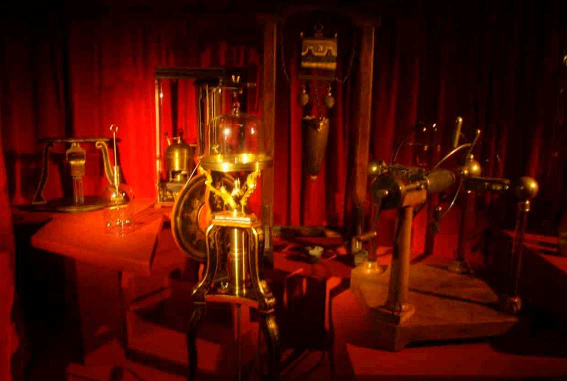
MUSEE DES ARTS ET METIERS, EXPOSITION «BENJAMIN FRANKLIN» | PARIS CONCEPTION & MAITRISE D'ŒUVRE