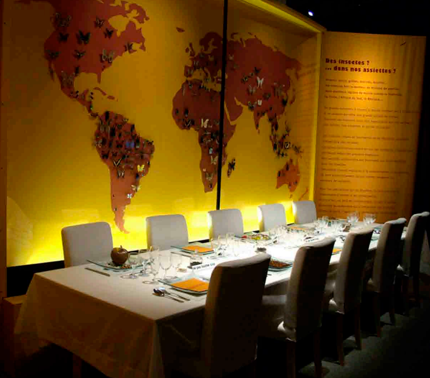
MUSEUM D'HISTOIRE NATURELLE DE LYON, EXPOSITION «INSECTE, JE VOUS AIME» CONCEPTION & MAITRISE D'ŒUVRE