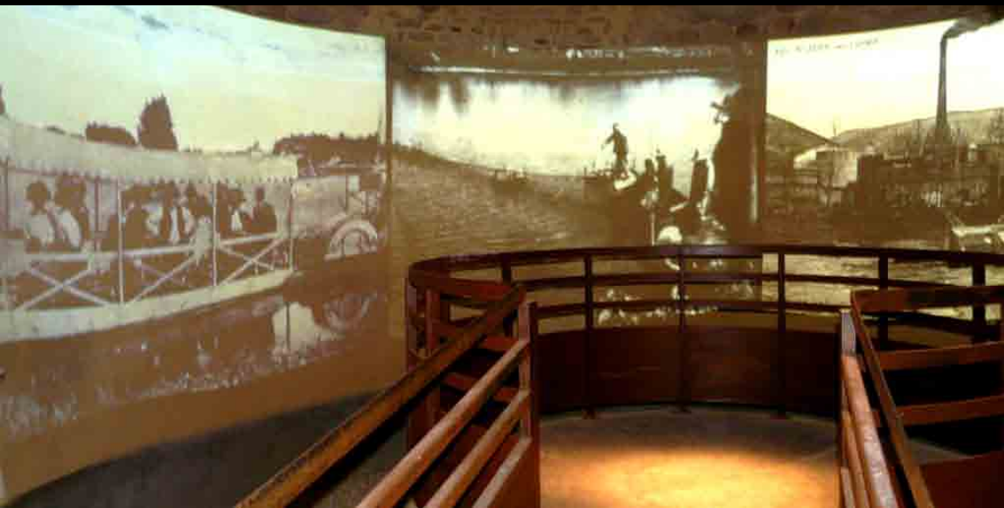
CHATEAU DE BOUTHEON | ANDREZIEUX-BOUTHEON CONCEPTION & REALISATION