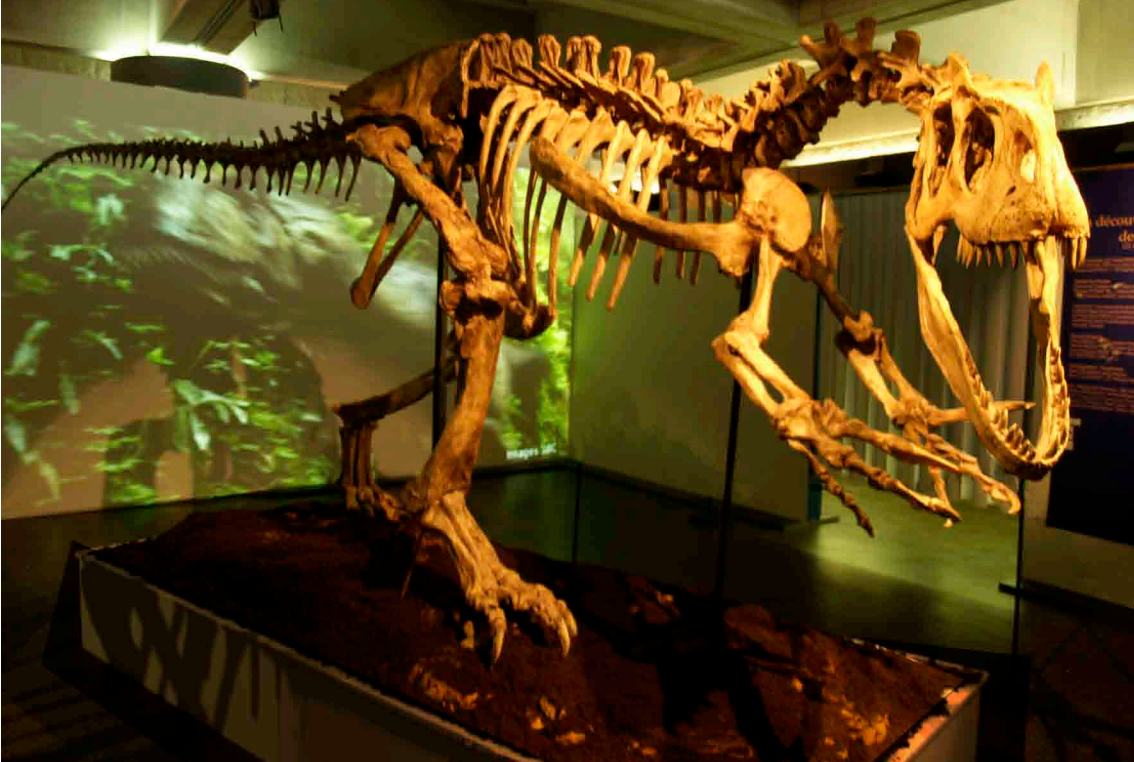
MUSEE DE PREHISTOIRE, EXPOSITION «A LA DECOUVERTE DES DINOSAURES» | SOLUTRE CONCEPTION & REALISATION