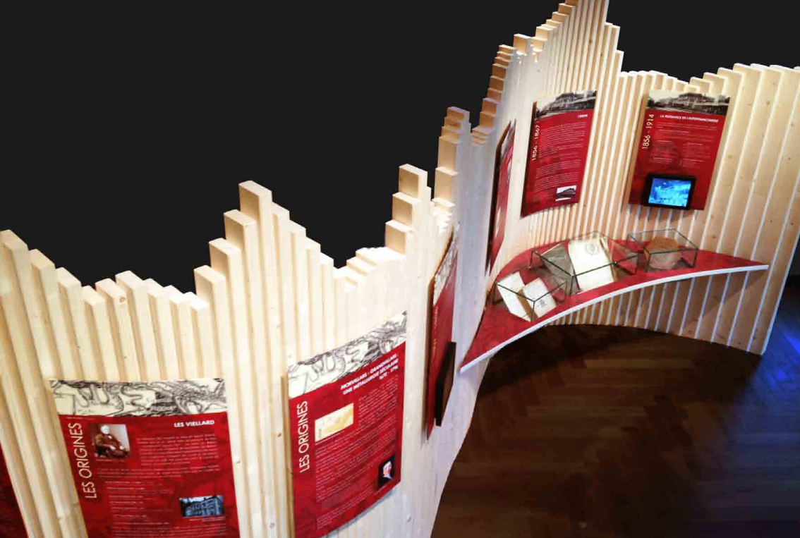
MUSEE DE L'ENTREPRISE VIELLARD MIGEON & CIE I MORVILLARS CONCEPTION & REALISATION