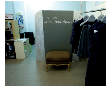
Élément lumineux séparant un atelier et une boutique.