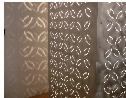
Bloc lumineux encastré dans un meuble pré-existant. Commande du cabinet d'architecture AIRE, Franck Vérité pour un particulier.