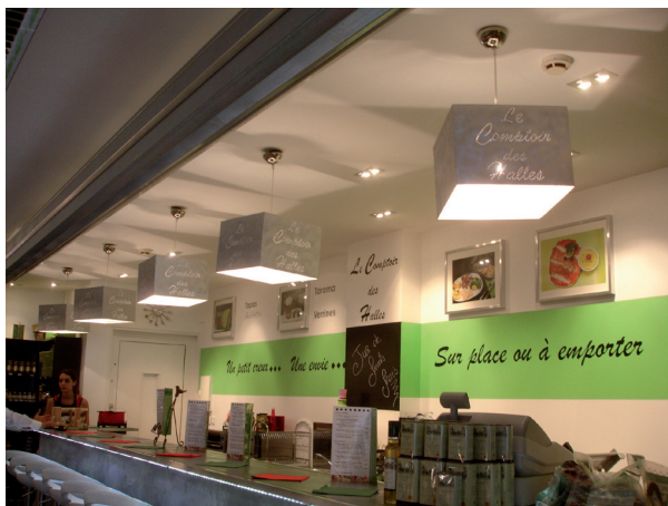
Luminaires cubiques «Le Comptoir des Halles» aux Halles Paul Bocuse .