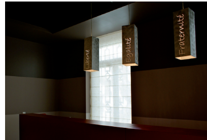
Mairie du 4ème , Lyon. Table du conseil éclairée par une suspension ovale (3m20*1m60). Ponctuation lumineuse pour le comptoir. Collaboration avec Thierry Odin, architecte d'intérieur.