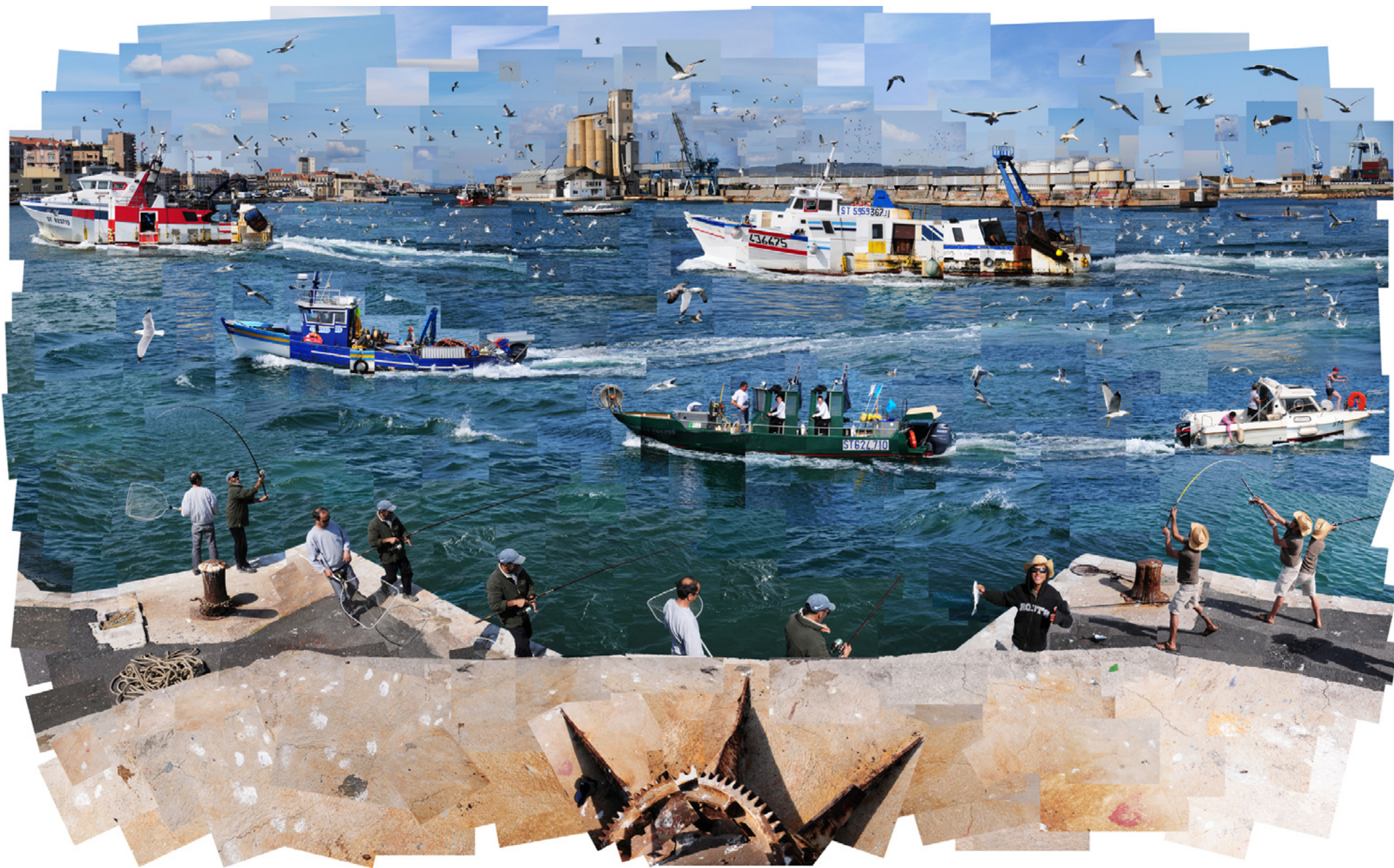
RETOUR DE PÊCHE / 2011 130 x 85 cm