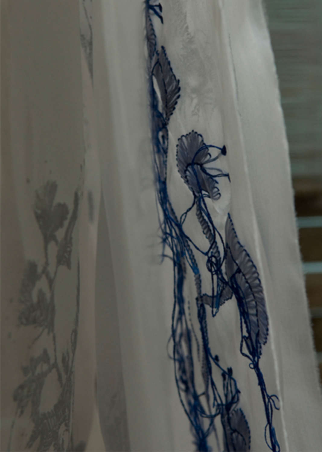
Plusieurs couches de soie, sérigraphie et broderie, 2009