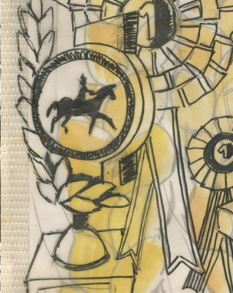
Dessin concept, 2007