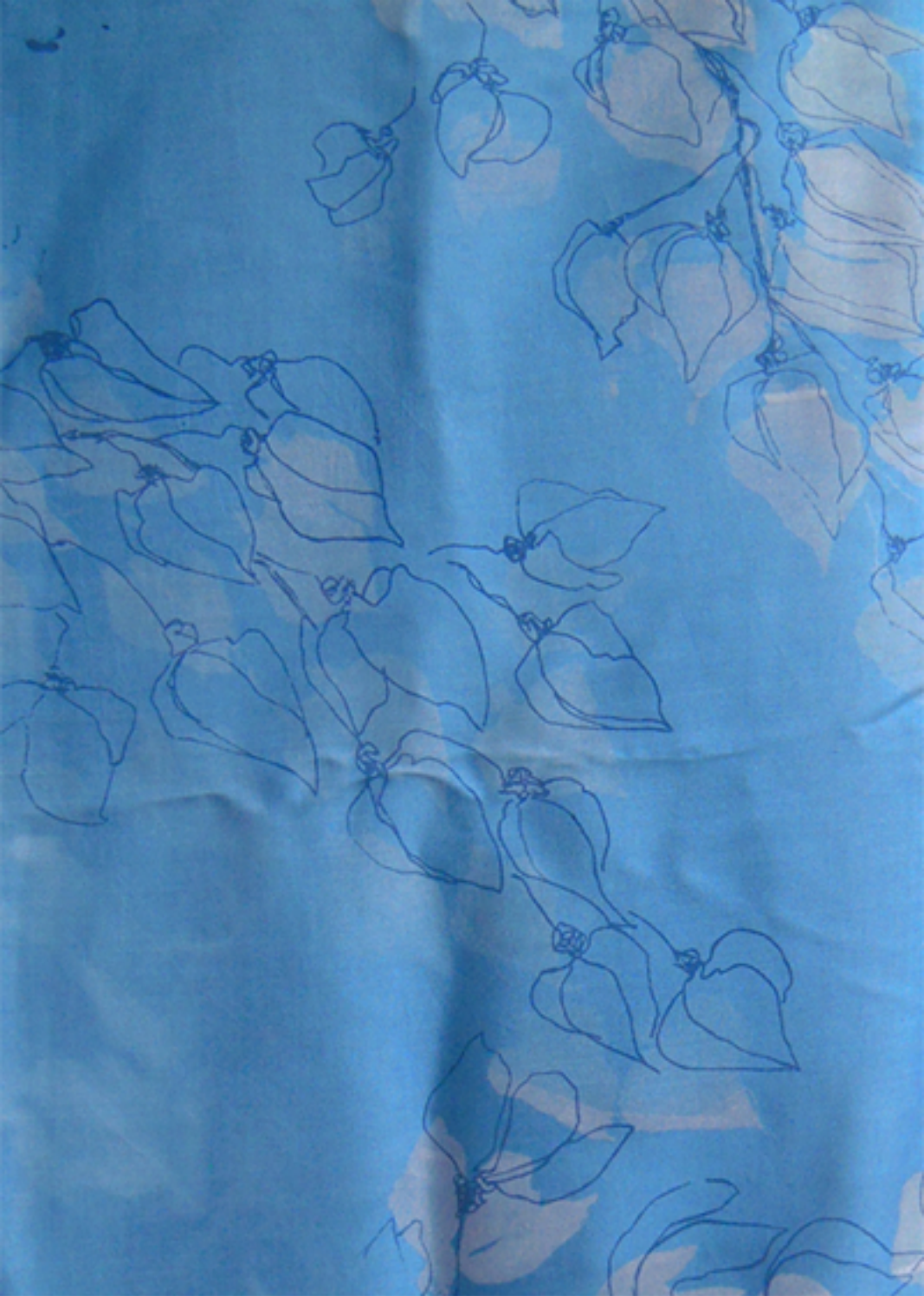
écharpe, soie, sérigraphie, 2011