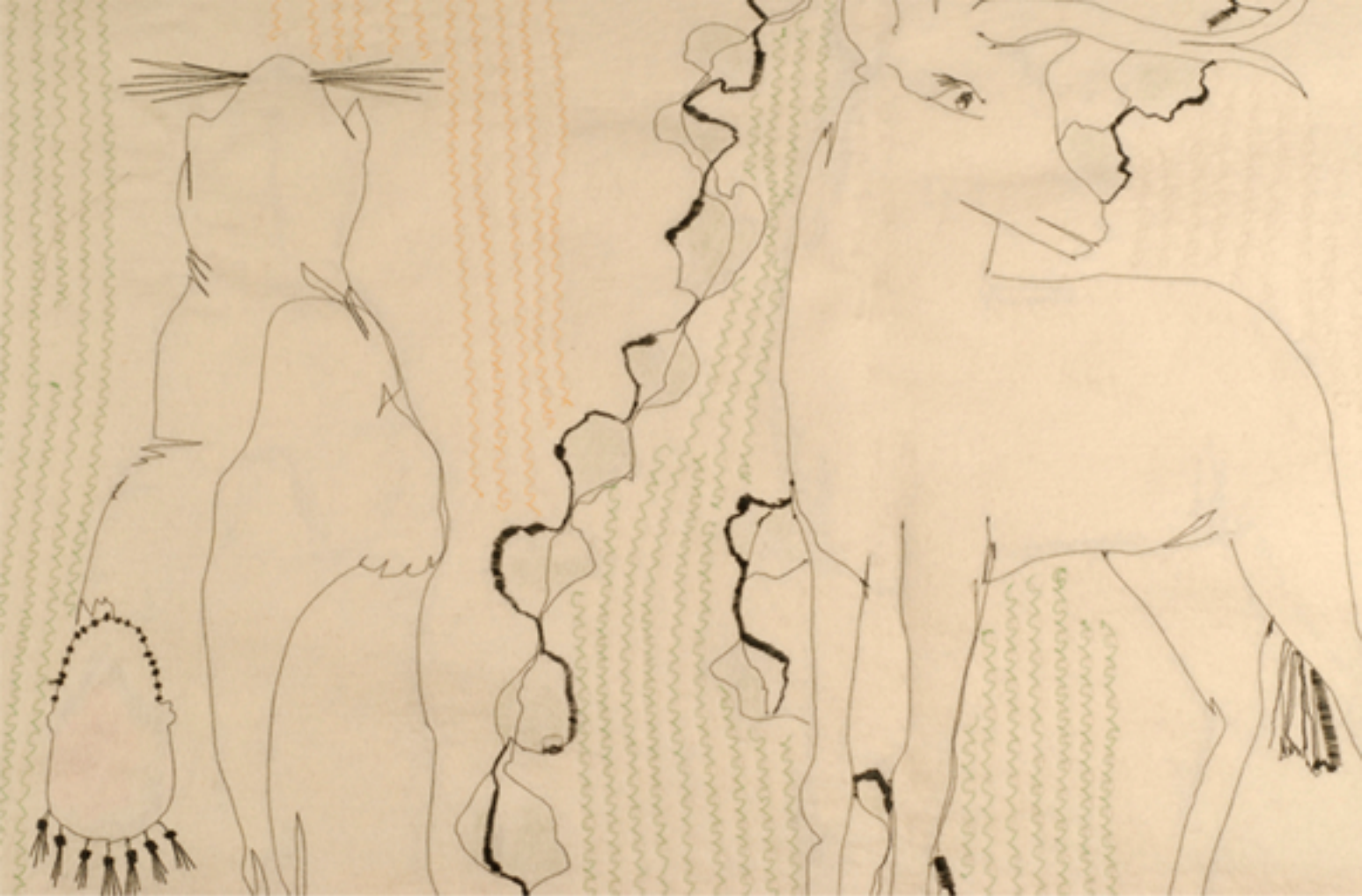
Motifs brodés sur feutre, 2006