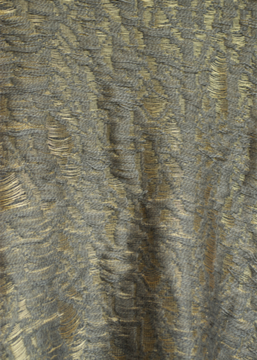
Laine et fil doré tricotés, 2008