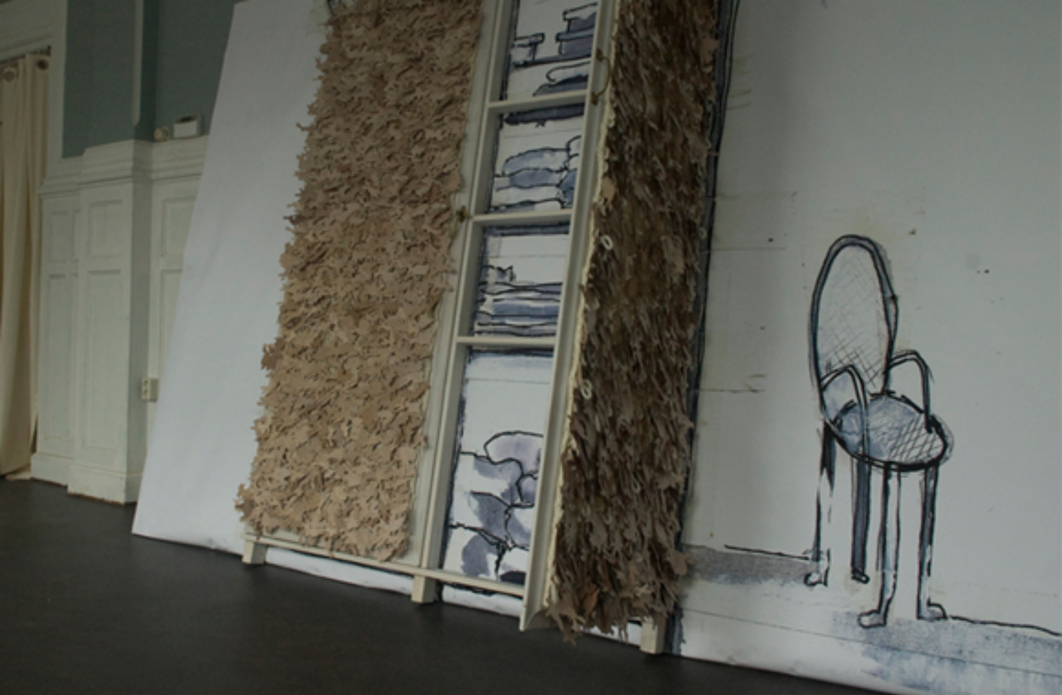
Lapins en bois sur laine tricotée. Papier peint, 2009