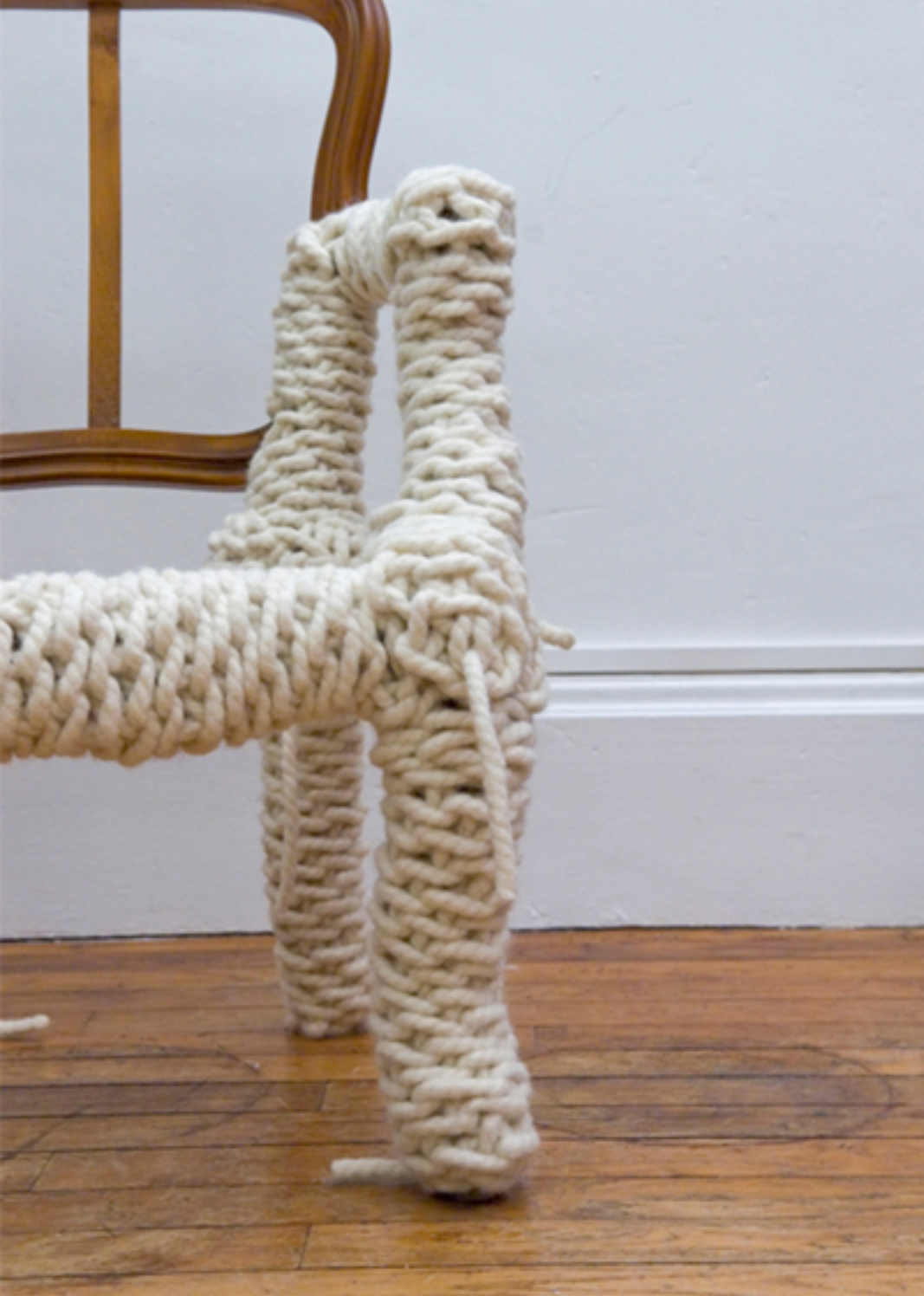
Laine crochétée à la main, 2010