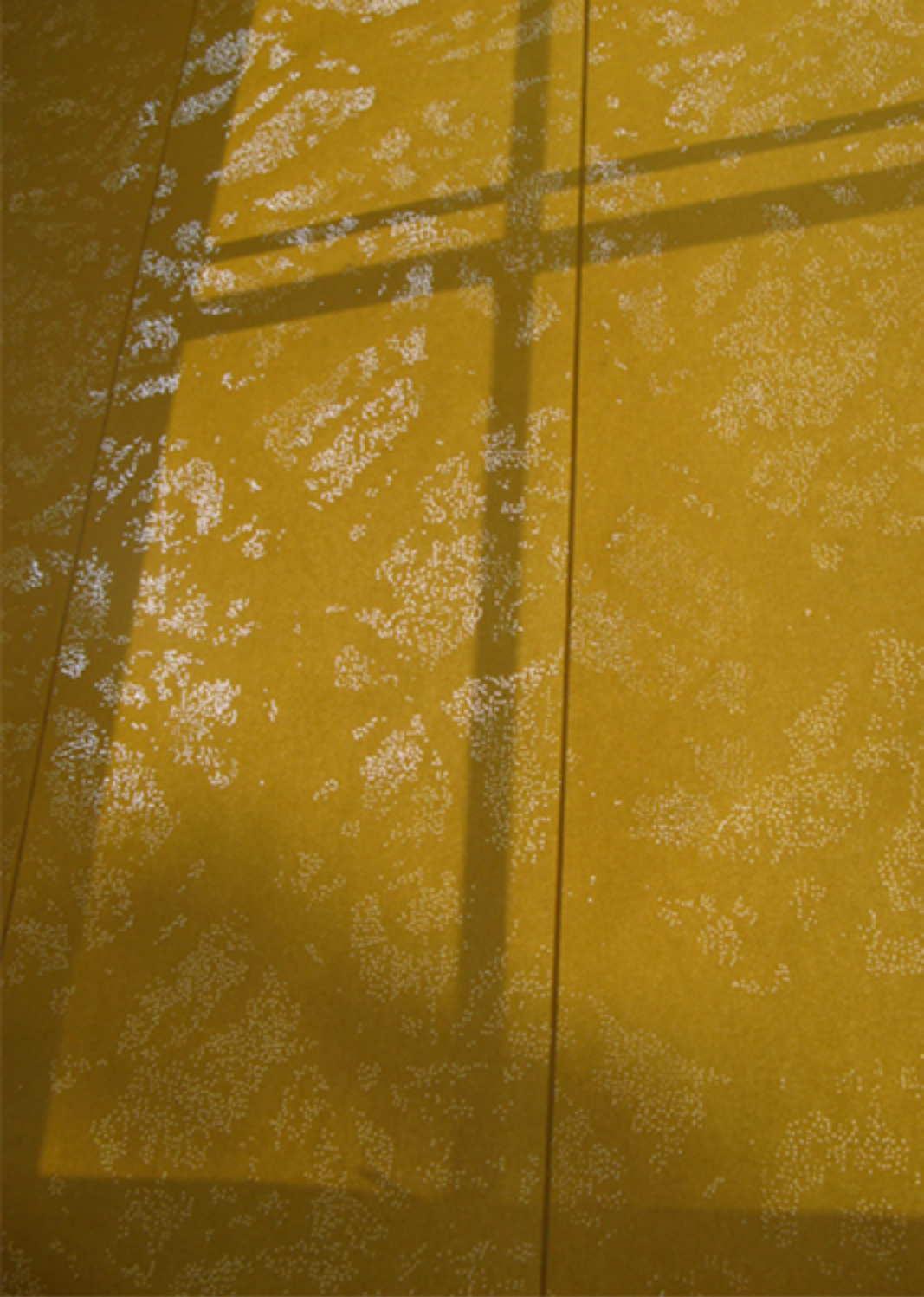
Papier peint, perforations, 2008