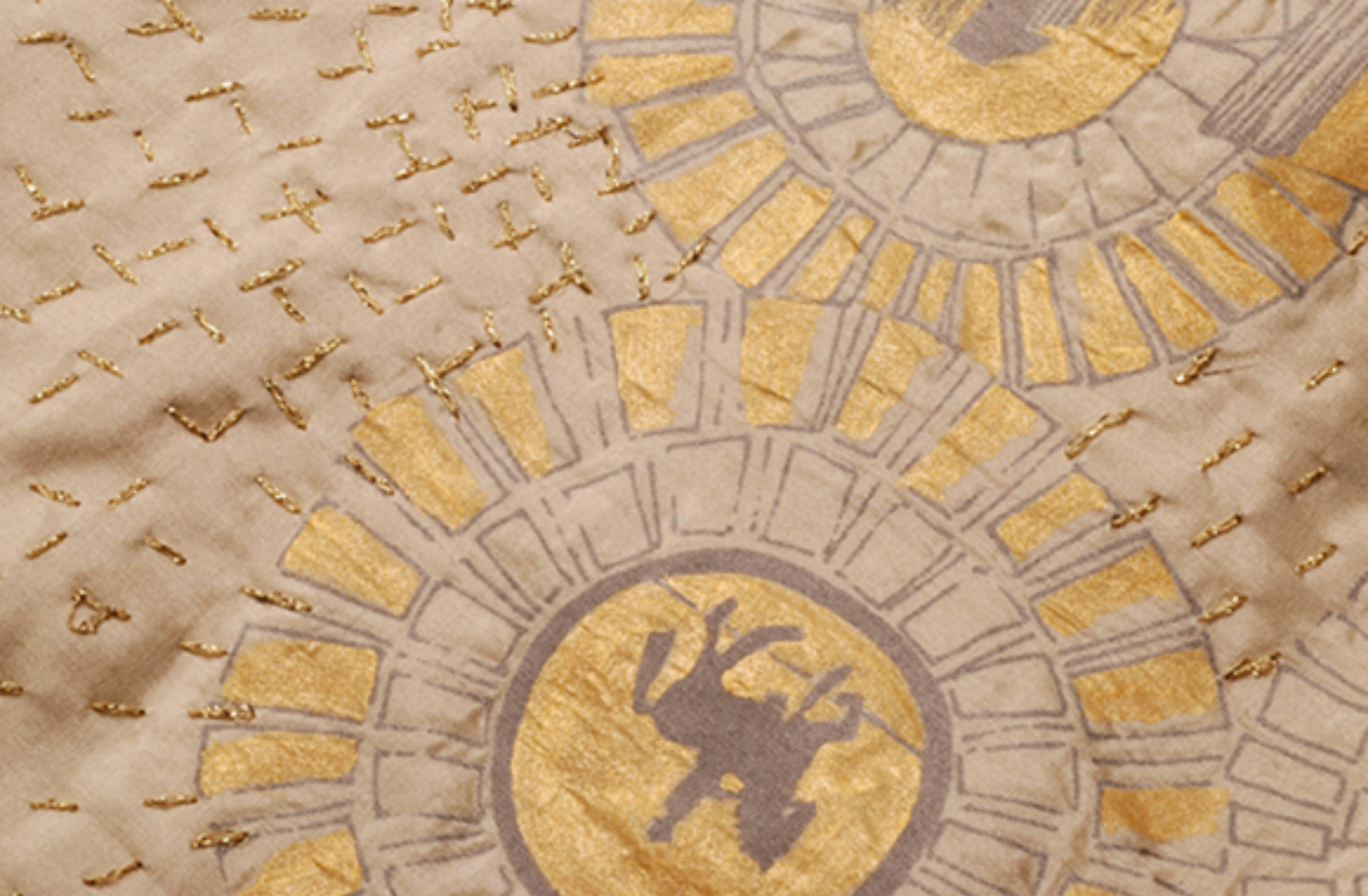
Motif sur soie et coton, sérigraphie et broderie, 2007