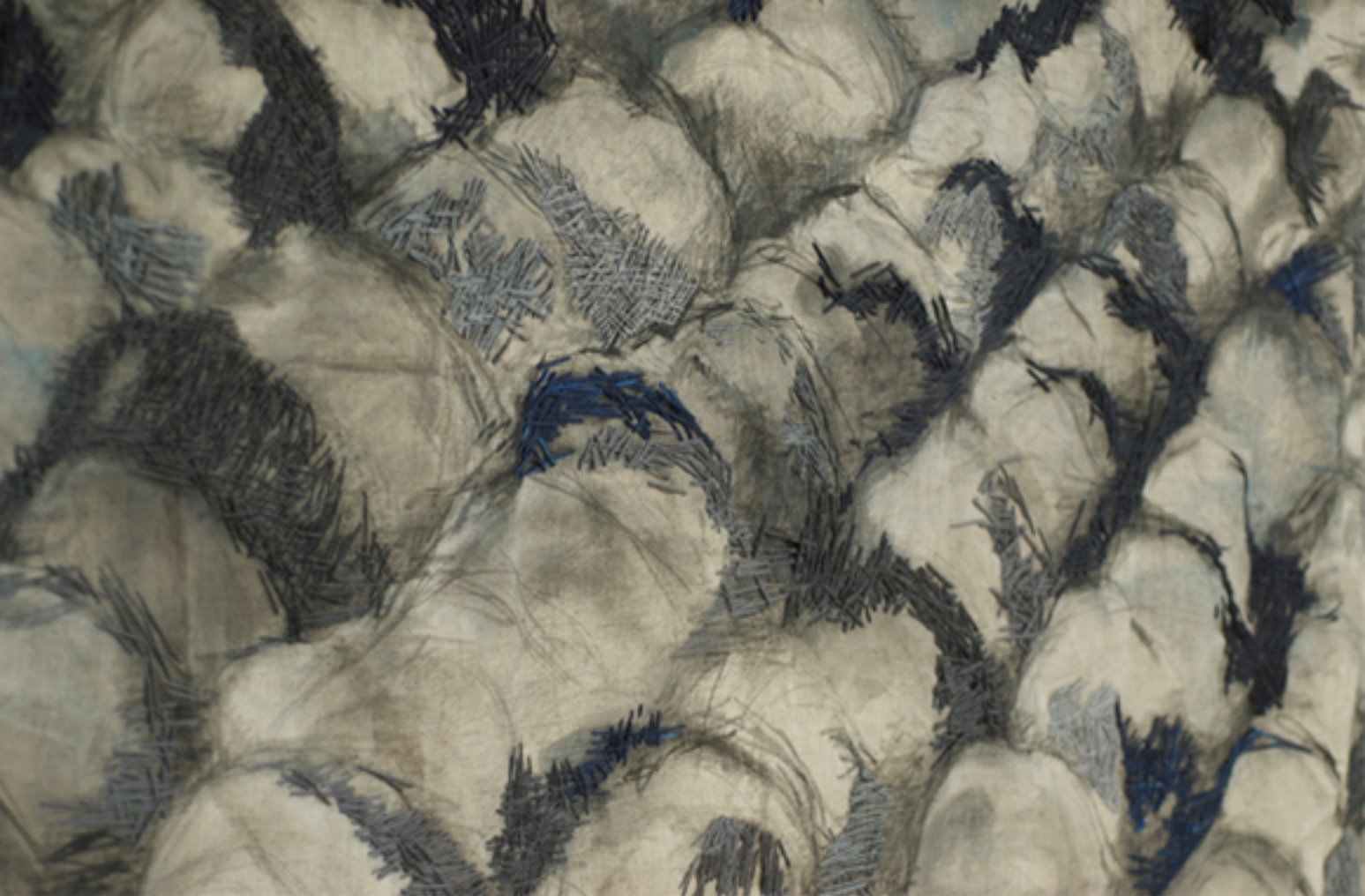
Peinture et broderie sur lin, 2008