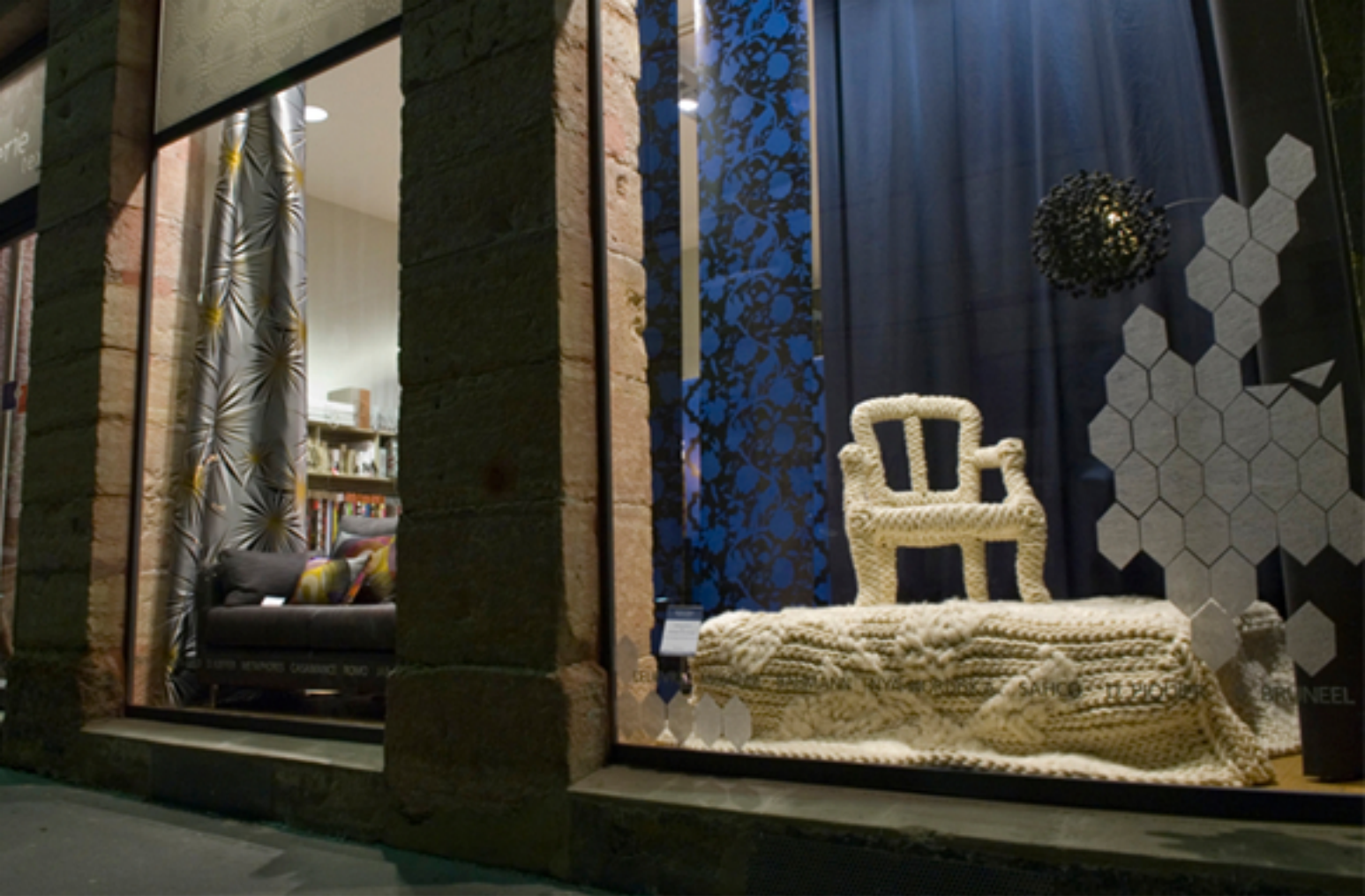
Laine crochétée à la main, 2010. Vitrine "La galerie textile", Lyon