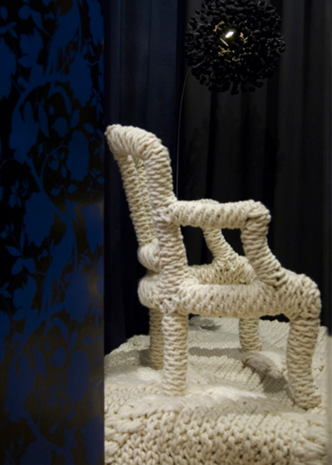
Laine crochétée à la main, 2010. Vitrine "La galerie textile", Lyon