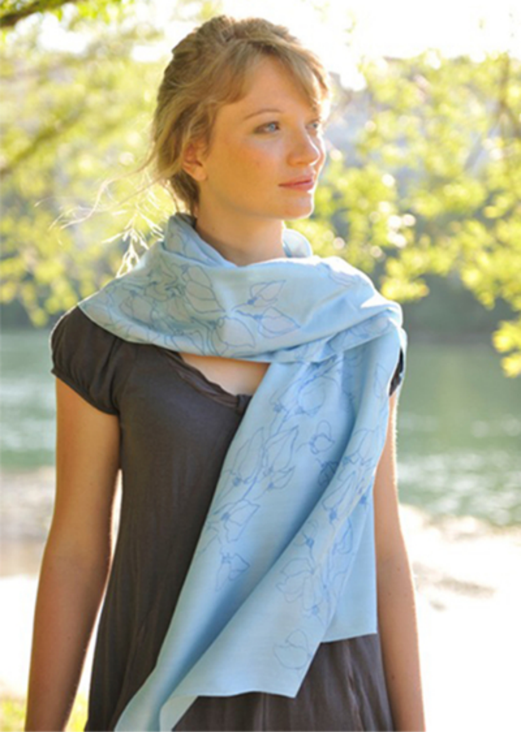
écharpe, soie, sérigraphie, 2011