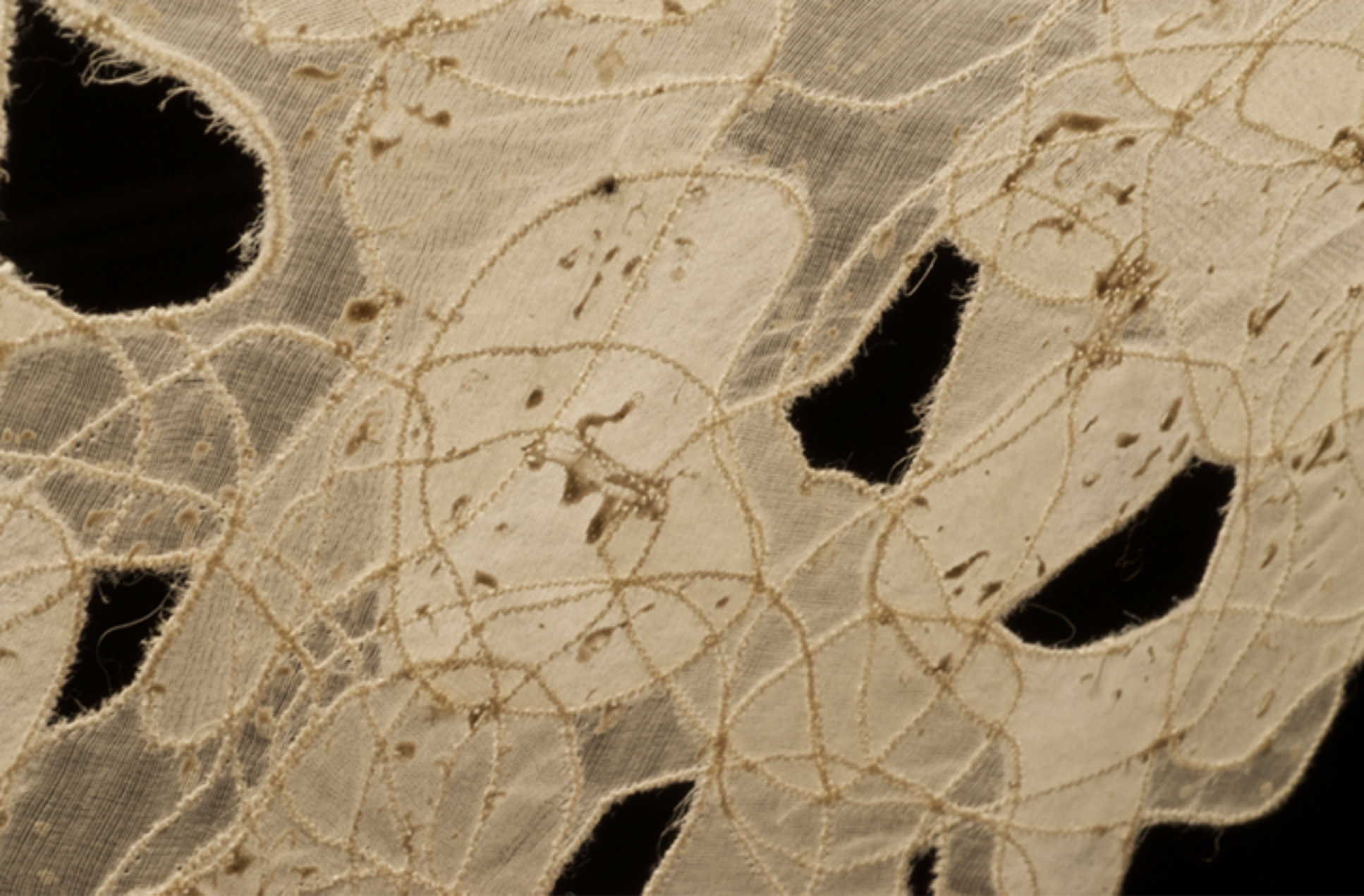
Broderies sur soie ajourée, 2006