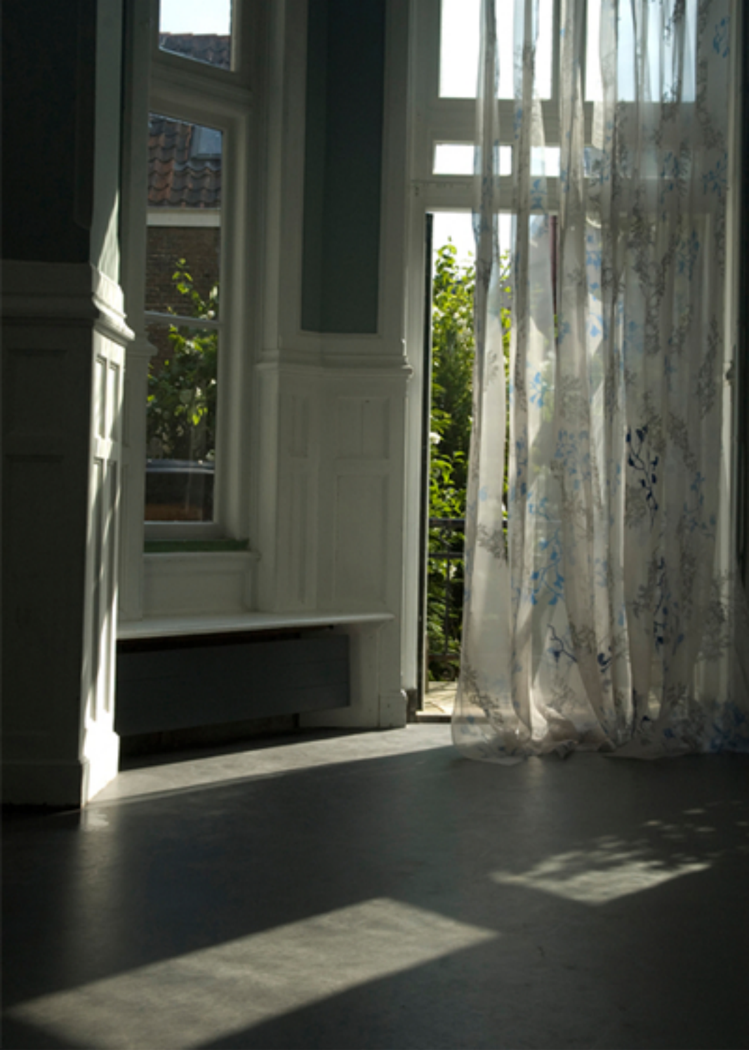
Plusieurs couches de soie, sérigraphie et broderie, 2009