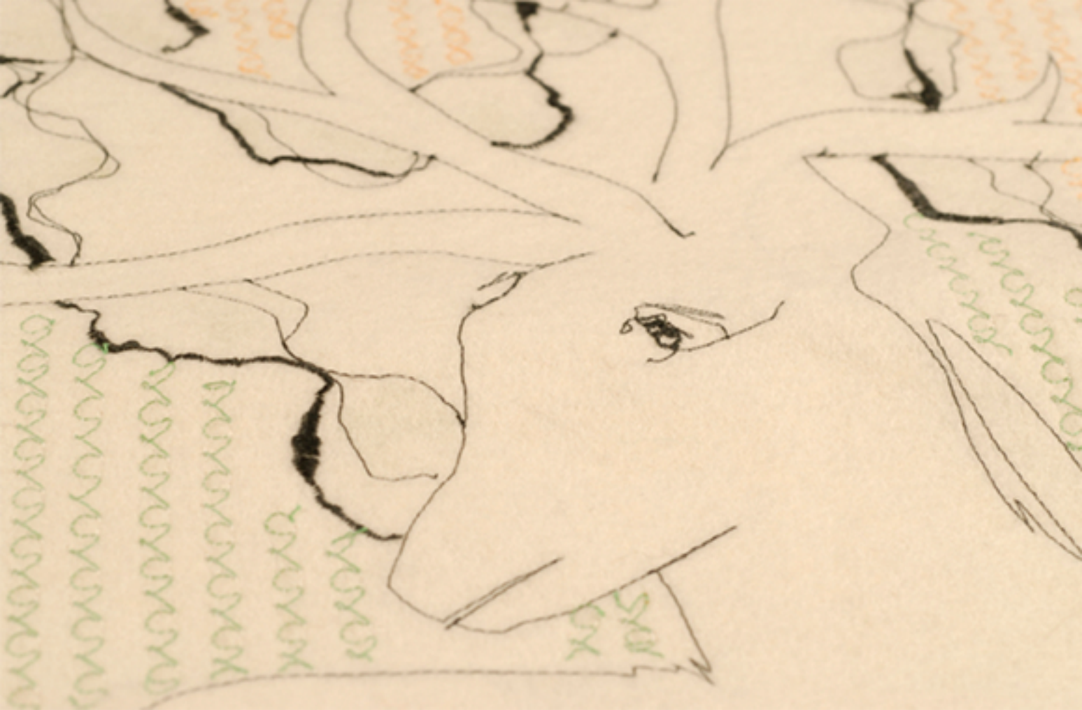
Motifs brodés sur feutre, 2006