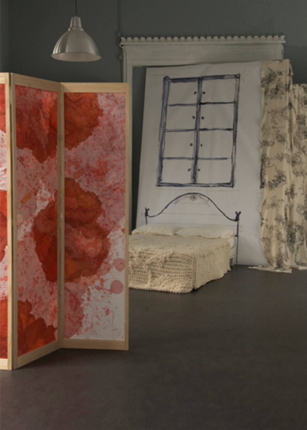
Paravent, soie peinte. Dessus de lit, laine cochetée à la main, 2009