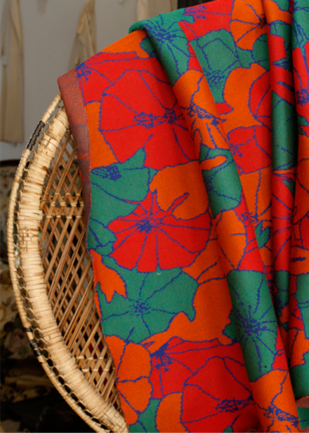
Motifs sur coton tricoté, 2009