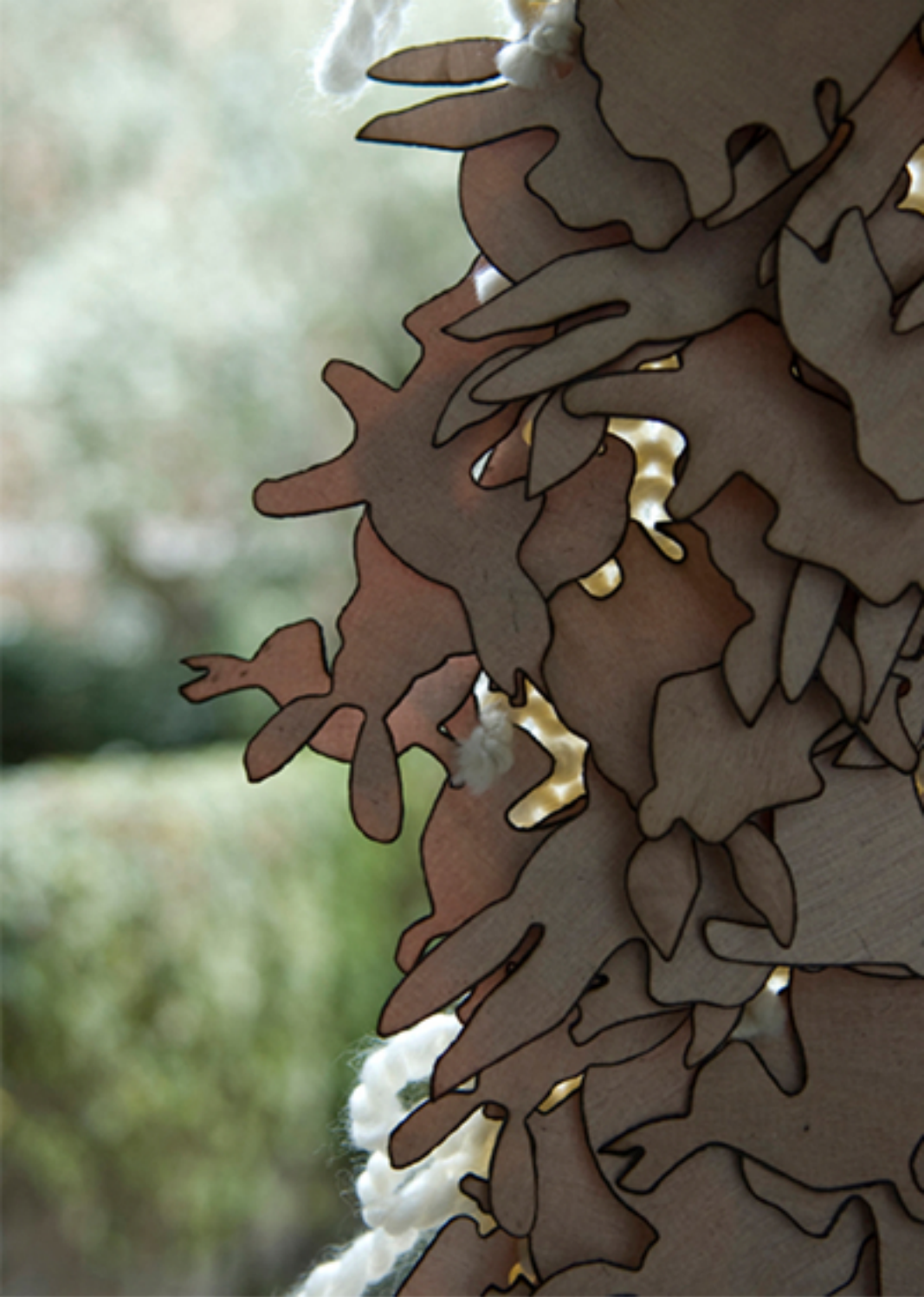
Lapins en bois sur laine tricotée, 2009