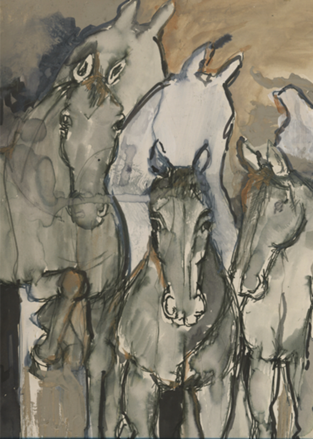
Dessin concept, 2007