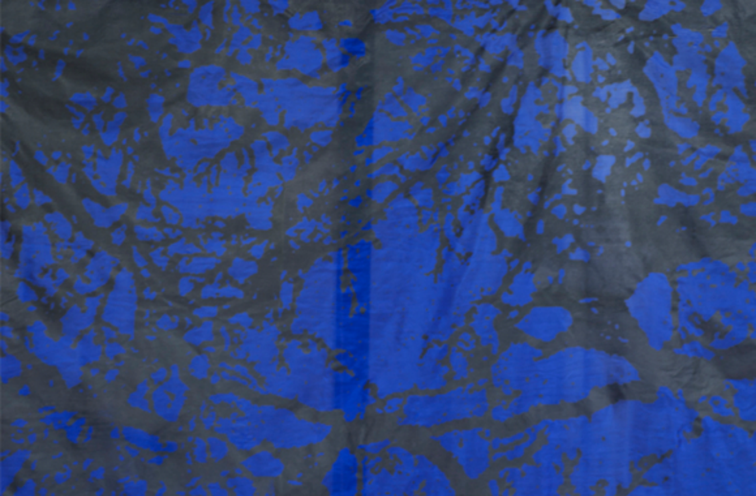
Soie teintée et sérigraphie, 2008