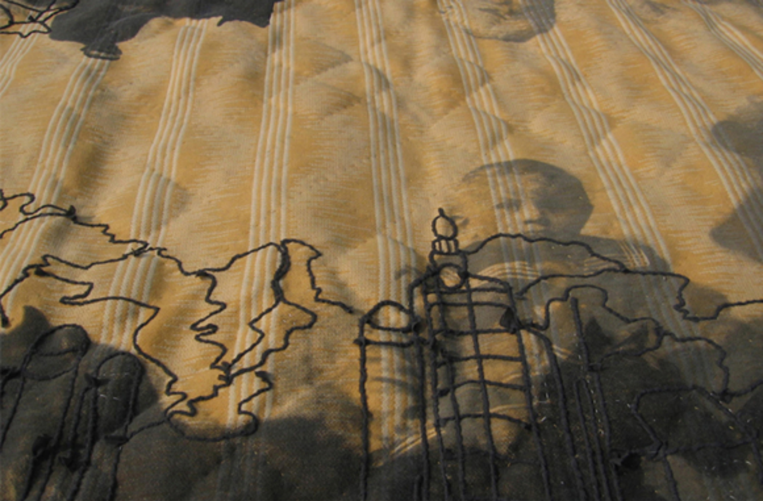
Tapis de laine, sérigraphie et broderie, 2007