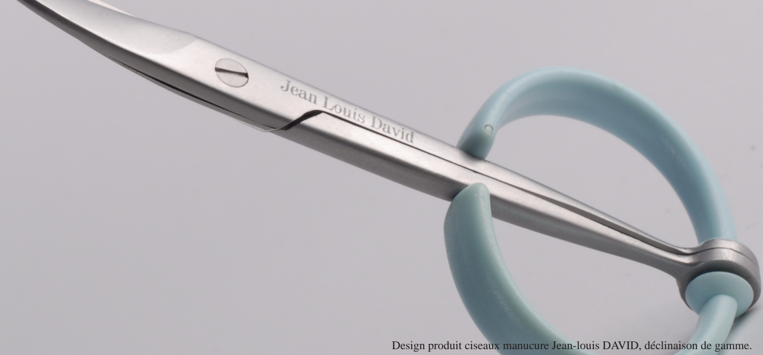
Design produit ciseaux manucure Jean-louis DAVID, déclinaison de gamme.