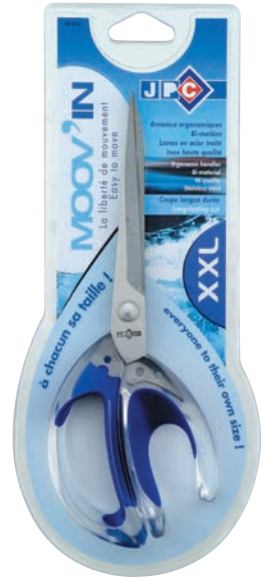
Design produit, recherche de nom, création du logotype, charte graphique, création carte support.