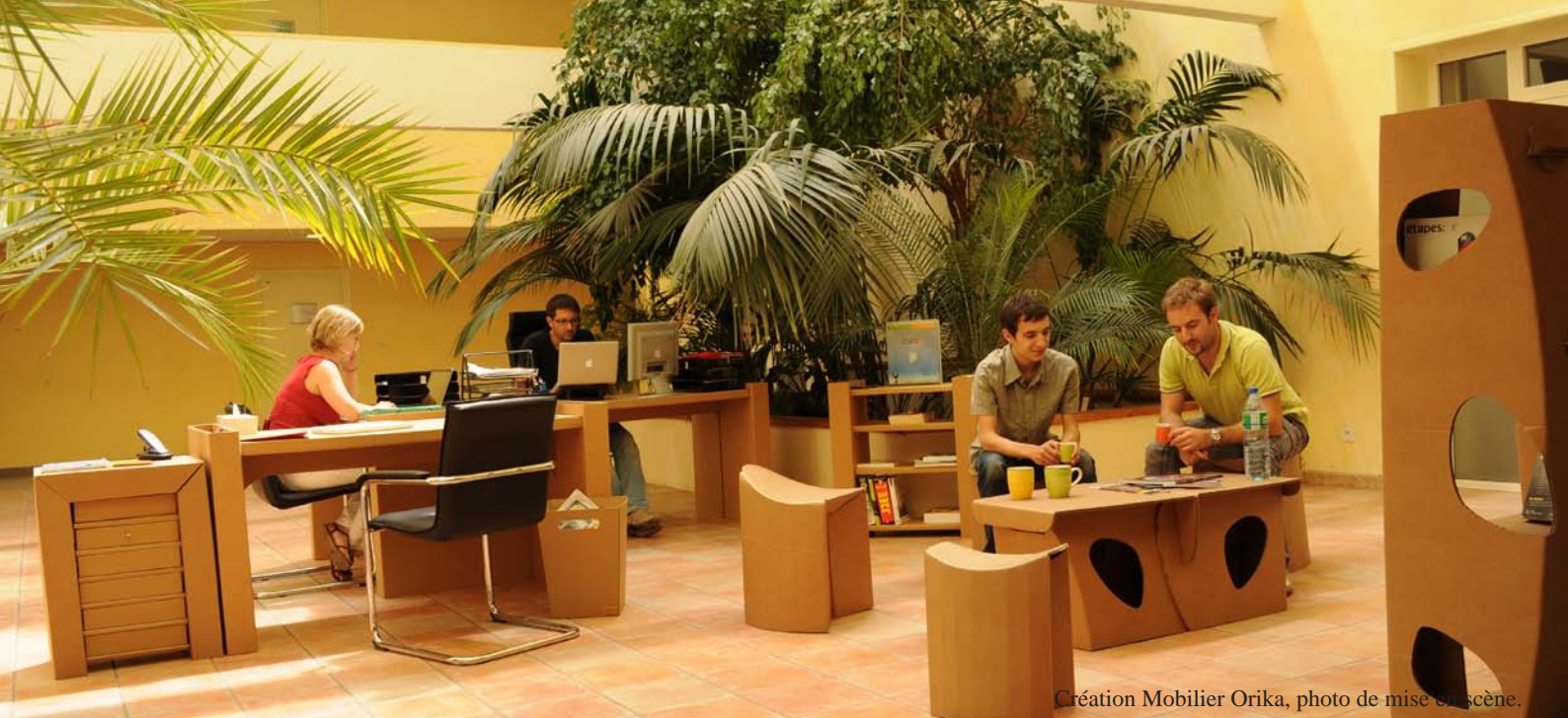
Création Mobilier Orika, photo de mise en scène.