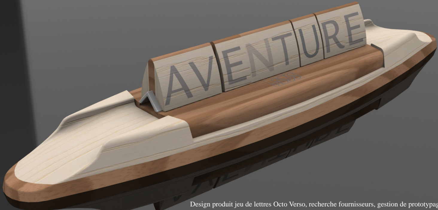
Design produit jeu de lettres Octo Verso, recherche fournisseurs, gestion de prototypage.