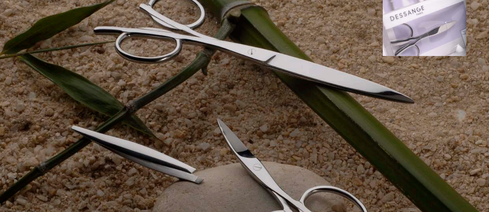
Design produit, déclinaison de gamme pédicure manucure